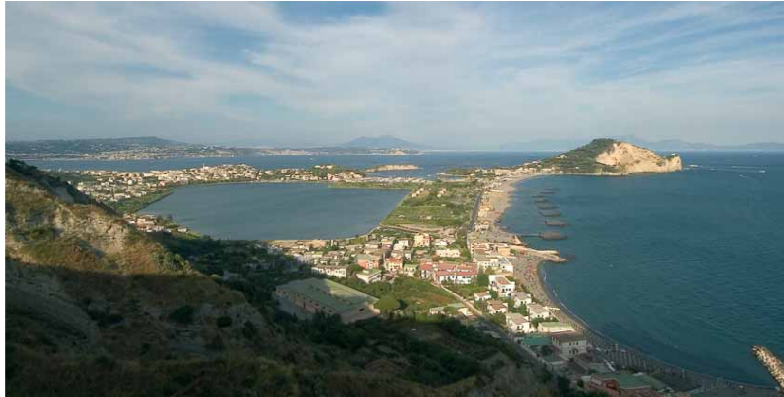
Lago Miseno da Monte di Procida