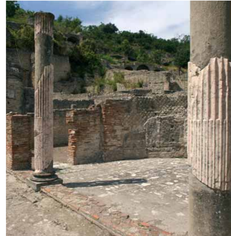
Le terme di Baia

www.regione.campania.it e-mail: assoc.misza@regione.campania.it Tel. 081 796 70 75 - Fax 081 796 60 12 Centro Direzionale, Isola A16 - Napoli Settore Beni Culturali Responsabile Misura 2.3 : Arch. Vincenzo Fusso del portale umano della imprenditorialità del settore cultura e del tempo libero (Azione e) Asses Il Misura 2.3 - Sviluppo delle Competenze Programma Operativo Regionale 2000-2006 Regione Campania grandeattrattoreculturale campi flegrei