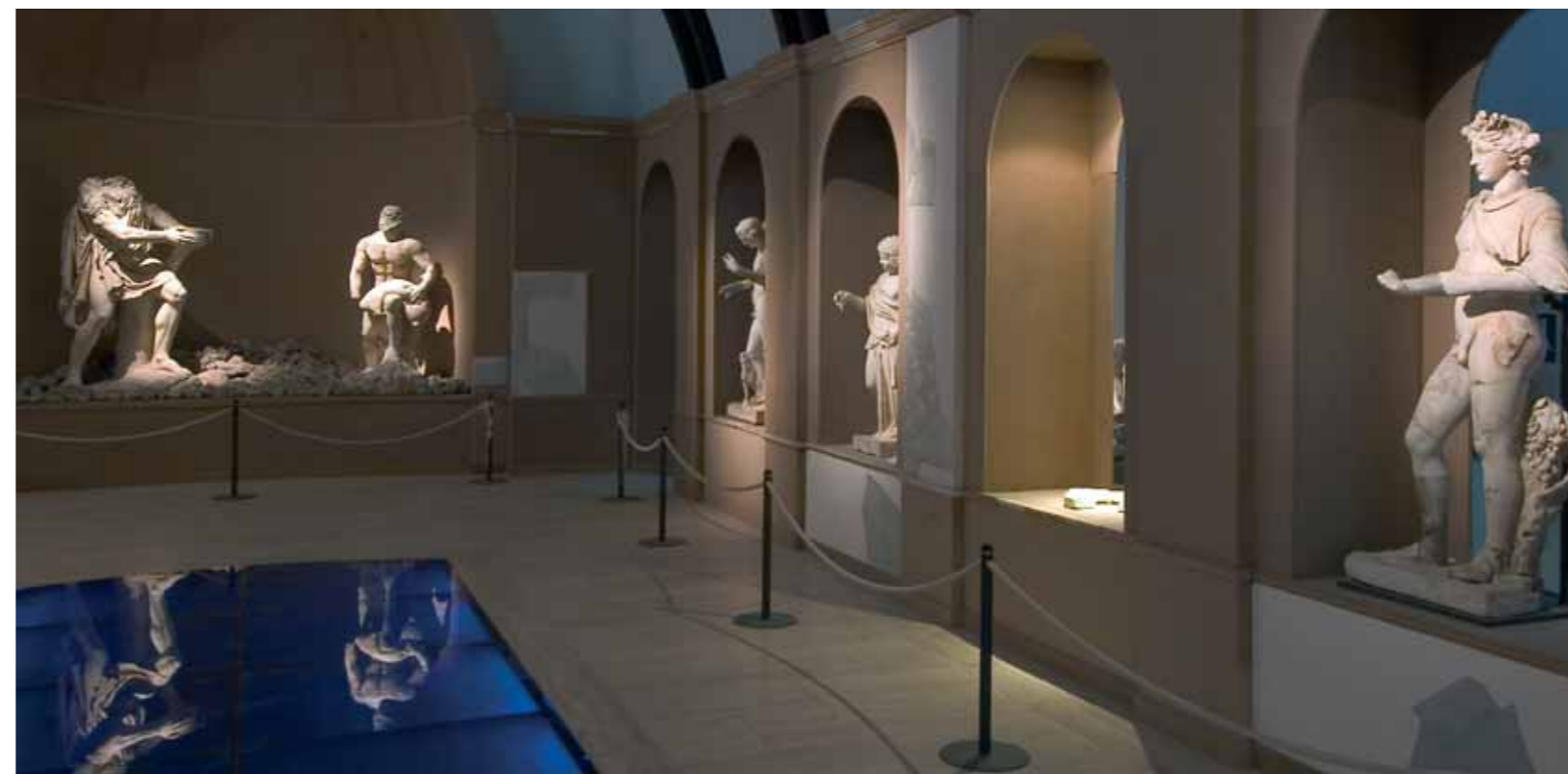
Museo archeologico del Castello di Baia: ricostruzione del Ninfeo di Punta Epitaffio