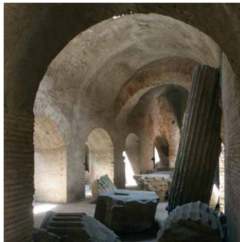
L'anfiteatro Flavio a Pozzuoli