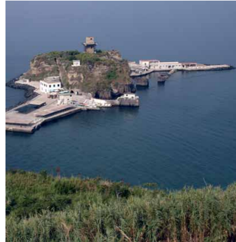
L'isolotto di San Martino