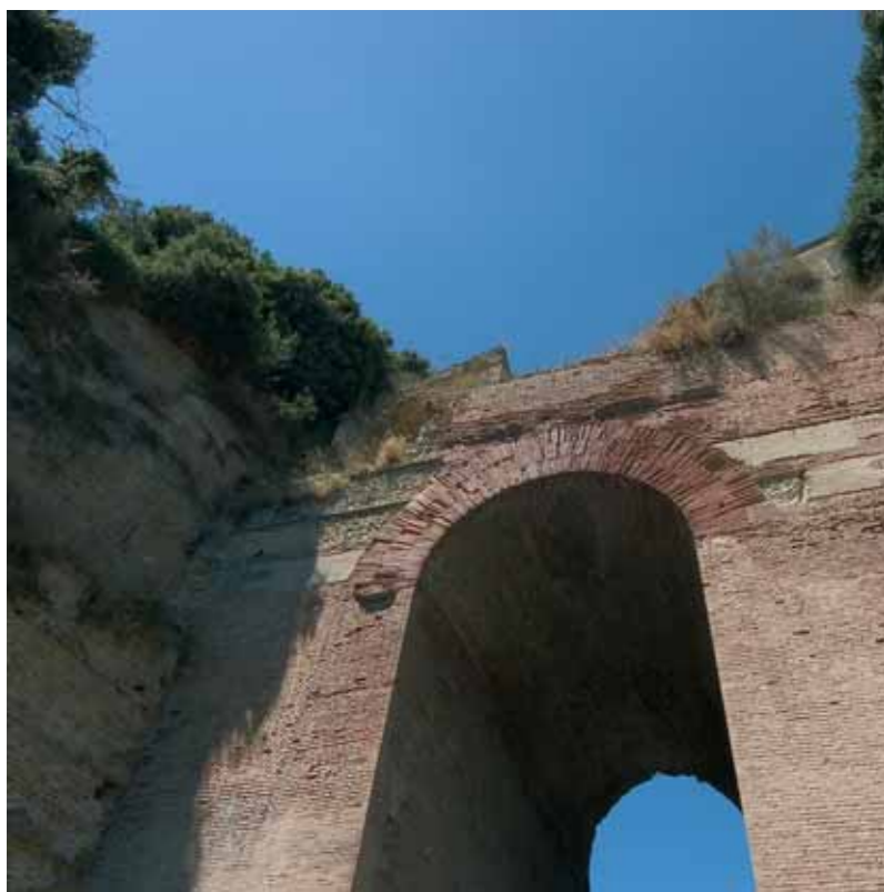
L'Arco Felice a Pozzuoli