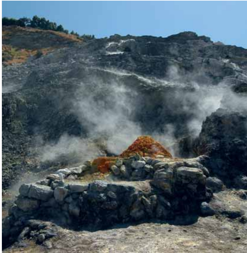
La soffata a Pozzuoli